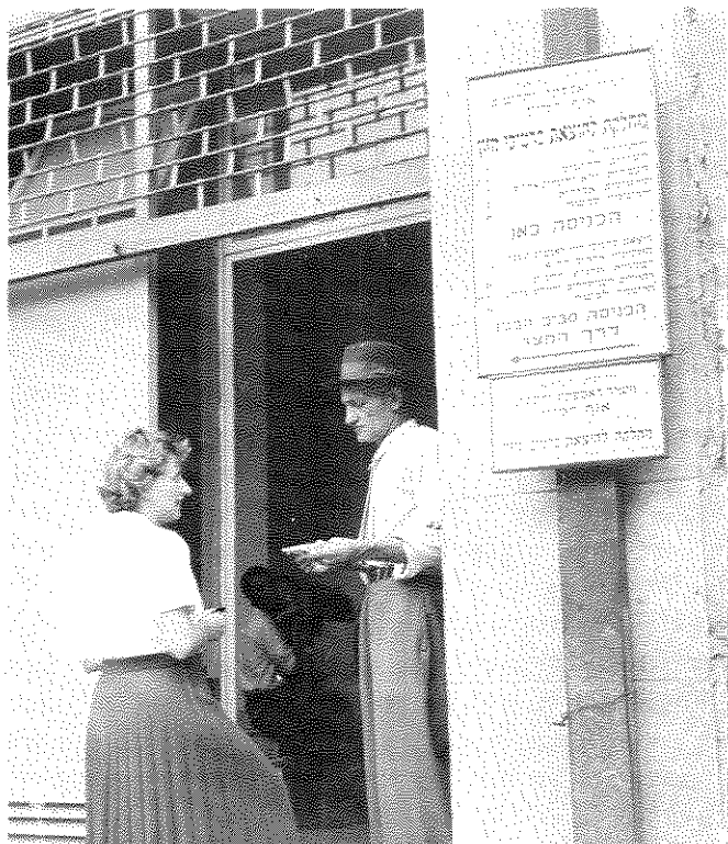
ממראות 1949: ימי הצנע והקיפוב

אני מציע לחברים שהלשכה תקבע ועדת תיאום, שתפעל בין "דבר" ו"הדור" [עתון צהריים של מפא"י], למען לא יקרו דברים שלא צריכים לקרות לכל הדעות. הופיעה ב"דבר" ידיעה שב"הדור" יש שביתה: האם זה לכבוד "דבר" והמפלגה? אפשר היה להרים שפופרת ולשאול אם יש אמת בדבר. למי מועילות ידיעות כאלה?! ברל לוקר: אדבר רק על עניין גרינברג. אני קצת משתומם על שהמפלגה שכחה דבר קטן. גרינברג חבר הנהלת הסוכנות וניתן לו תפקיד ידוע בה. הוא צריך לעמוד בראש מחלקת החינוך והתרבות של הנהלת הסוכנות, והמחלקה הזאת עדיין לא אורגנה.