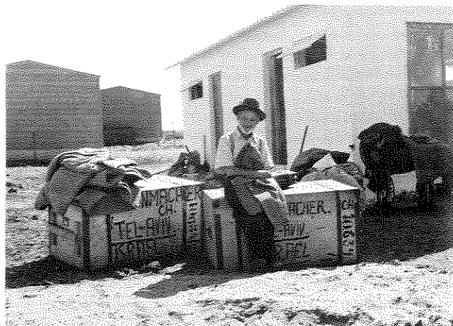
ממראות 1949: עולה חדש, ביומו הראשון בארץ

אני מוכרח להגיד שתי מילים בעניין מדיניות החוץ. משהו השתנה בעולם מקצה לקצה. עלינו לראות את הדבר. אני מציע שבמים הקרובים ביותר, בזמן שייקבע ויוכרוז עליו כאן, נקיים דיון במוכרות לא על שאלות "דבר", אלא על שאלה זו. היא אינה קשורה דווקא עם שאלות "דבר", אלא זו שאלה של מדיניות החוץ של ממשלת ישראל, ההסתדרות והמפלגה. אני רוצה להבליט זאת. עומדות על הפרק שאלות "דבר" המחייבות דיון, אולם בעניין זה אין לחכות ואסור לחכות.