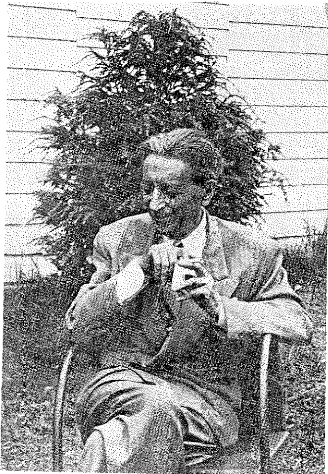
אחת מתמונותיו האחרונות של חיים גרינברג (נפטר ב-1953), שלא זכה לכתן כעורך "דבר".

ישראל מרמינסקי: לכתוב לגרינברג שסכנה למפלגה ולהסתדרות באם לא יבוא — ולא טלגרמה. באם לא יבוא נהיה נאלצים לוותר לגמרי על ההצעה. זה צריך להיות לפני הוועידה, אחרת נאבד גם את המקום. לכתוב צריך לא רובשוב אלא שפרינצק [ויש] להסביר לו על הסכנה הצפויה שייגמר הפרק של עורך. הצעה אחרת אין לנו.